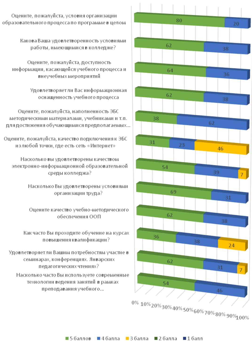
Рис. 1. - Результаты опроса педагогических работников об удовлетворенности качеством образовательной деятельности по профессии 08.01.07 Мастер общестроительных работ